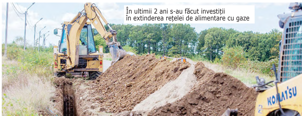
În ultimii 2 ani s-au făcut investiții în extinderea rețelei de alimentare cu gaze

Persoanele fizice atestate pentru funcția de administrator în conformitate cu prevederile Legii nr. 230/2007 privind înființarea, organizarea și funcționarea asociațiilor de proprietari, cu modificările și completările ulterioare, pot îndeplini funcția de administrator numai dacă obțin certificate de calificare profesională care dovedesc calificarea profesională pentru a îndeplini ocupația de administrator, în conformitate cu Legea 196/2018.