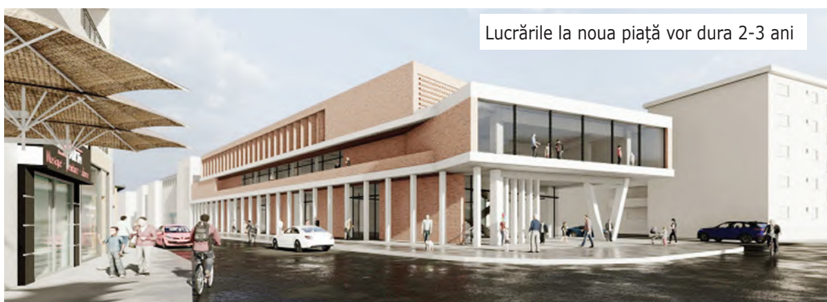
Lucrările la noua piață vor dura 2-3 ani

persoane cu dizabilități. 4778 metri pătrați va fi suprafața totală desfășurată a viitoarei piețe.