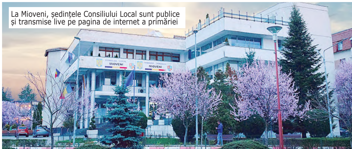
La Mioveni, ședințele Consiliului Local sunt publice și transmise live pe pagina de internet a primăriei