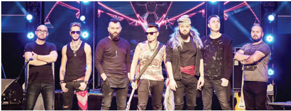
Lupii lui CALANCEA vor face show duminică, 3 iulie