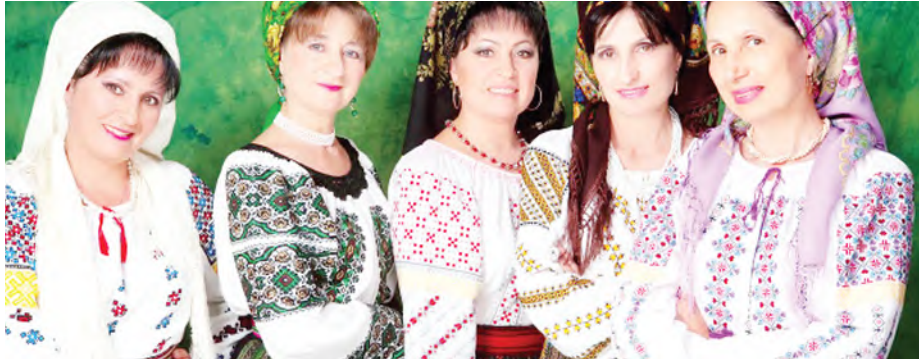
Surorile Oșoianu vor încânta publicul duminică, 3 iulie