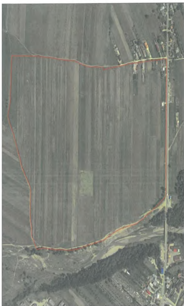
Localitatea MIOVENI - SECTOR 5 Scara 1:5000