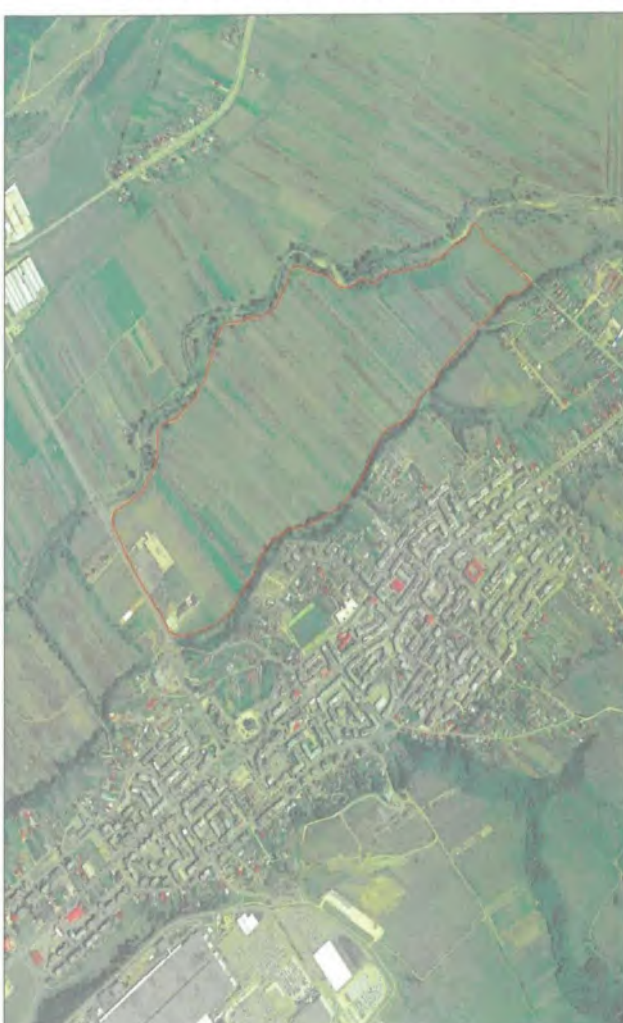
Localitatea MIOVENI - SECTOR 23 Scara 1:5000