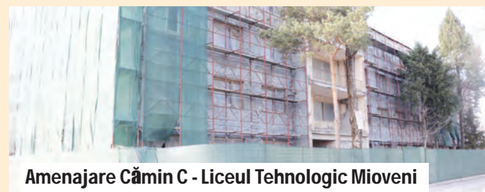
Amenajare Cămin C - Liceul Tehnologic Mioveni