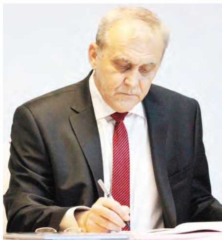
Stimați cetățeni ai orașului Mioveni,

HOTĂRĂRILE CONSILIULUI LOCAL MIOVENI: emioveni.ro/consiliul-local/hotararile-adoptate