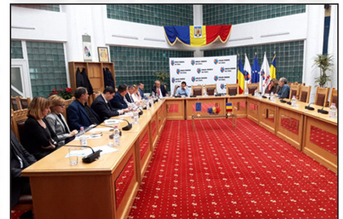
Întâlnirea Grupului Local de Dialog ALFRED, 2019

Activitatea GLD a fost reluată în anul 2019 iar discuțiile cu membrii GLD au fost deschise și constructive. S-a constatat un sprijin real și favorabil al comunității pentru proiectul ALFRED considerând beneficiile legate de crearea de noi locuri de muncă, creșterea economiei locale, păstrarea tinerilor valoroși în comunitate, diversificarea economiei locale și reducerea riscurilor unei dependențe majore de industria auto, creșterea vizibilității și prestigiului localității, precum și îmbunătățirea serviciilor locale.