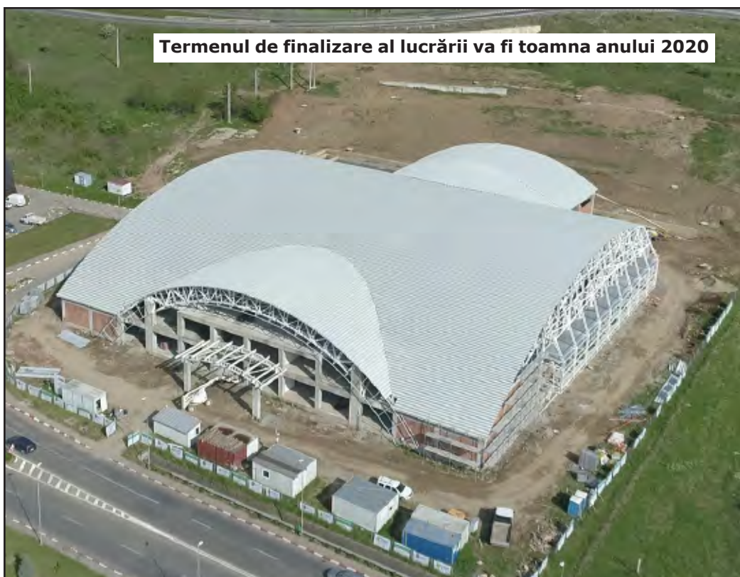
Termenul de finalizare al lucrării va fi toamna anului 2020

Amenajările exterioare vizează parcuri, alei carosabile, spații verzi și împrejurimi.